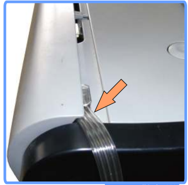
Вывод шлейфа iP1000

При закрытой крышке, шлейф не должен пережиматься.