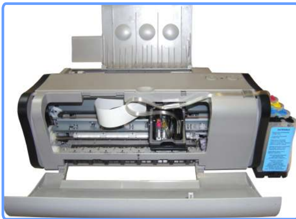
Установленная система iP1000

После заполнения чернилами шлейфа, капсул и Ваших ёмкостей, принтер готов к работе. Убедитесь что воздушные отверстия ёмкостей открыты, капилляры шлейфа нигде не пережаты, а каретка свободно достаёт до своих крайних положений. Включите принтер и сделайте тест дюз. Если на тесте видны не все дюзы, дайте принтеру пару прочисток из стандартной утилиты драйвера и оставьте его на некоторое время, это необходимо чтобы из головки вышел попавший туда воздух.