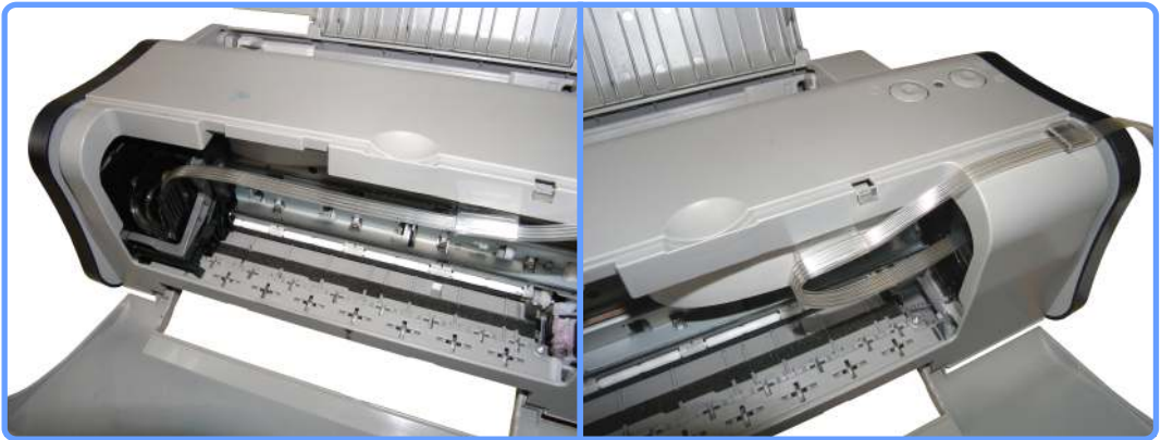
Вывод шлейфа iP1000

Отрегулируйте длину шлейфа таким образом, чтобы в крайнем левом и правом положении каретки шлейф нигде не пережимался и не натягивался.