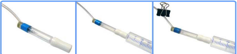
Заправка системы iP1000

Заполните все капсулы соответствующими цветами чернил на половину, для чего наденьте по очереди капсулы на шприц и вытягивайте воздух поршнем до тех пор, пока шлейф и капсула не заполнятся чернилами. После чего пережмите шлейф биндером и, сняв капсулу со шприца, установите её в каретку принтера на положенное место.