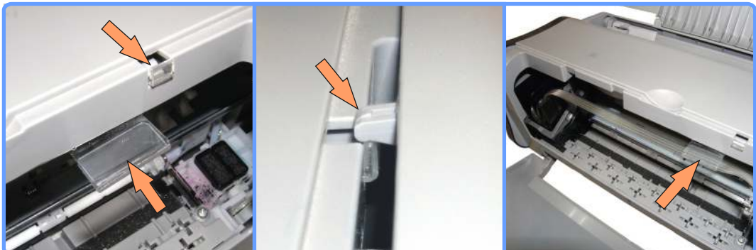
Прокладка шлейфа iP1000

Отведите каретку влево до упора, и проложите шлейф в полочку подвеса, так чтобы он излишне не перегибался и не провисал.