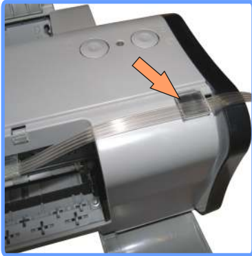
Вывод шлейфа iP1000

Приклейте клипсу с правой стороны принтера и закрепите в ней шлейф, немного наискосок.