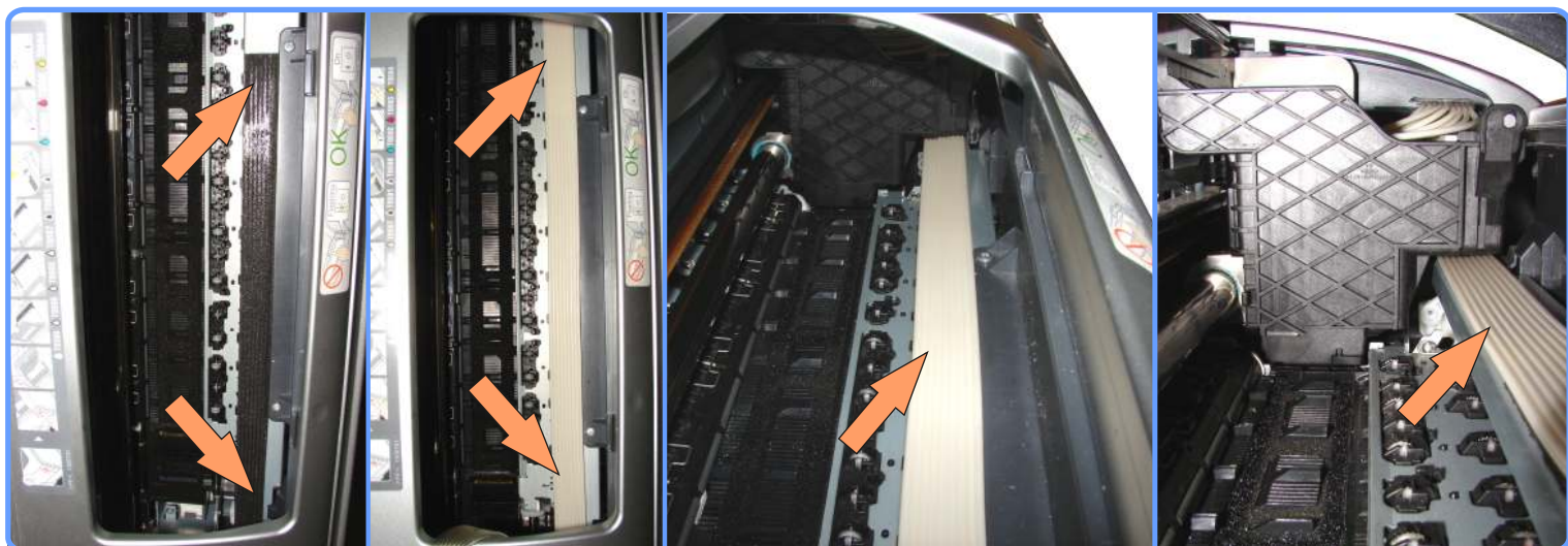
Прокладка шлейфа R2400

Приклейте двусторонний скотч, как показано на фото. Отведите каретку до упора вправо, следя чтоб шлейф не перегибался, не натягивался и не мешал движению каретки. После чего приклейте шлейф на двусторонний скотч.