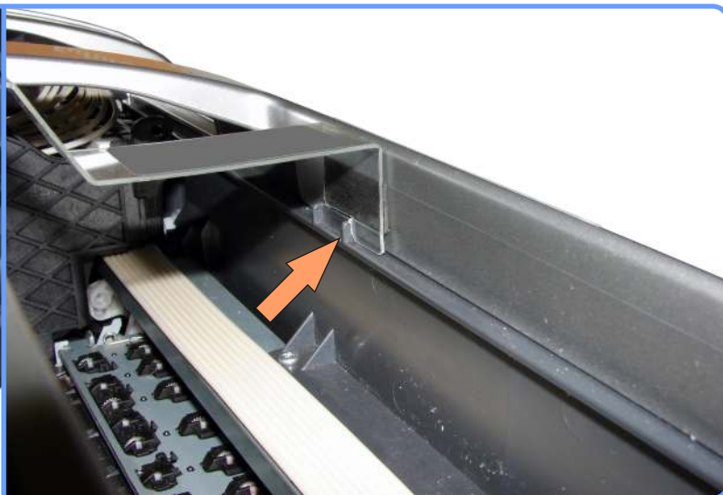
Прокладка шлейфа R2400