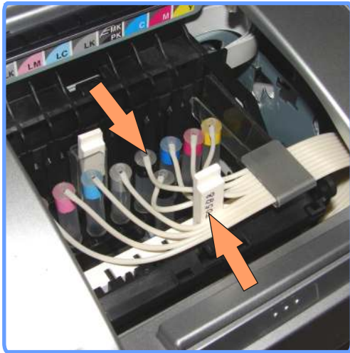
Смена капсулы R2400

После заполнения чернилами шлейфа, капсул и Ваших ёмкостей, принтер готов к работе. Убедитесь что воздушные отверстия ёмкостей открыты, капилляры шлейфа нигде не пережаты, а каретка свободно достаёт до своих крайних положений. Включите принтер и сделайте тест дюз. Если на тесте видны не все дюзы, дайте принтеру пару прочисток из стандартной утилиты драйвера или SSC ( http://www.ssclg.com ) и оставьте его на некоторое время, это необходимо чтобы из головки вышел попавший туда воздух.