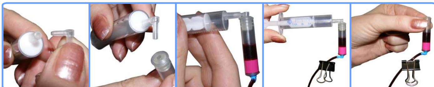
Заправка капсул и шлейфа R220

Отстыкуйте капсулу от шприца и наденьте капсулу на соответствующий чернильный штуцер печатающей головки принтера. После этого можно освободить зажим.