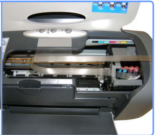
Прокладка шлейфа R220