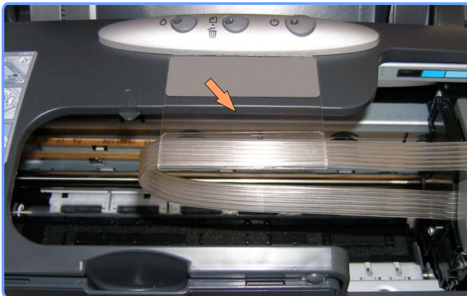
Установка полочки-подвеса R220

Закрепите полочку подвеса шлейфа, как показано на фото.