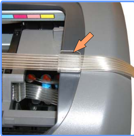
Вывод шлейфа R220

Установите клипсу с левой стороны аппарата, и выведите через неё шлейф.