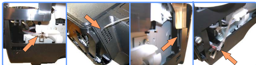
Удлинение капилляра стока SP1410

Соедините капилляр стока с капилляром идущим от помпы, при помощи переходника. Постарайтесь плотнее соединить капилляры, нельзя допустить их случайного рассоединения. Зафиксируйте место соединения капилляра помпы и переходника железным зажимом.