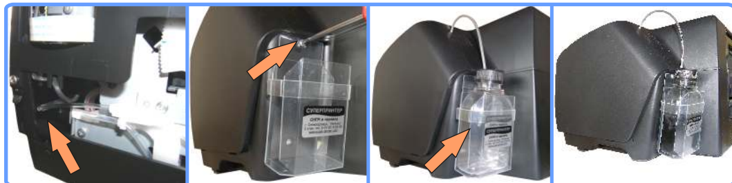
Установка держателя стока SP1410

На последнем фото, отображён сток в работе. Вы сможете визуальнo контролировать наполнение ёмкости отработанными чернилами и при наполнении ёмкости, легко опустошать её.