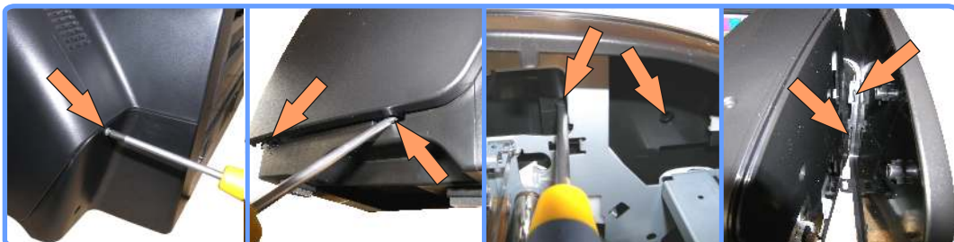
Снятие боковой панели SP1410

Освободите две защёлки внизу боковой панели, и нажав отвёрткой на панель изнутри принтера (на фото показаны две точки для нажатия) снимите её.